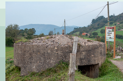
Panel 3. Posición El Xerru. Toño Huerta