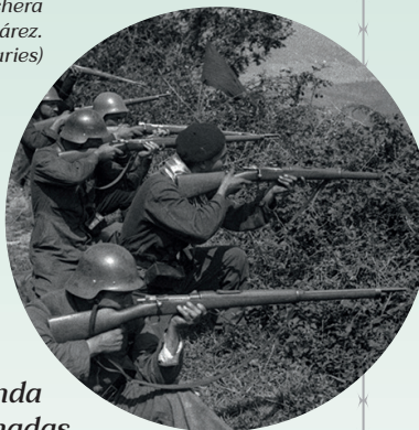
Fotografía: Soldados en el frente occidental

La llegada de la guerra a Salas se produciría a lo largo de los meses de agosto y septiembre de 1936, cuando diversas columnas gallegas toman sucesivamente La Espina, Salas y Cornellana. Desde ese momento diversos movimientos militares harían que se tomaran posiciones que permanecerían más o menos estables, con un contingente republicano en torno a la pequeña población de Nava, con tres posiciones fortificadas en el Pico Menudeiro, El Xerru y el Coruxu, mientras que las tropas nacionales permanecerían en la cercana sierra de Las Traviesas.