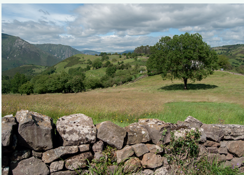
Paisaje de Nava. Toño Huerta

El itinerario tiene un recorrido de apenas 5 kilómetros y es apto para todo tipo de público; en el mismo, además de un entorno paisajístico de gran valor y unas amplias vistas de los valles y montañas circundantes, el aspecto didáctico y divulgativo es fundamental. Una extraordinaria forma de disfrutar de una jornada que se puede complementar con alguno de los muchos atractivos que tiene el concejo de Salas.