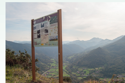
Panel 2. Vistas a los valles del Narcea y Pigüeña. Toño Huerta